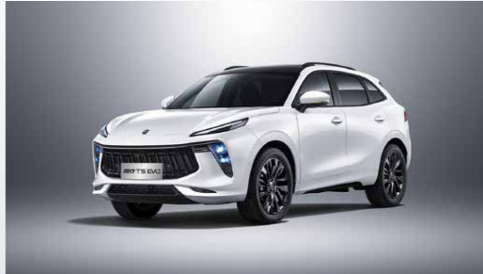
biela (čierna strecha)