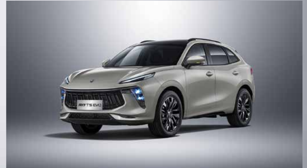
sivá (čierna strecha)