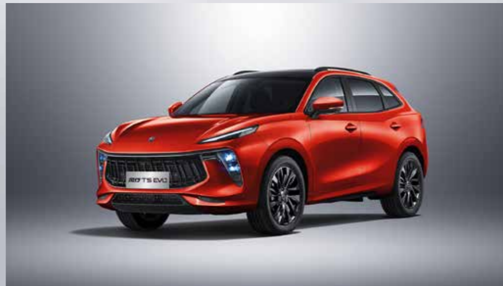
červená (čierna strecha)