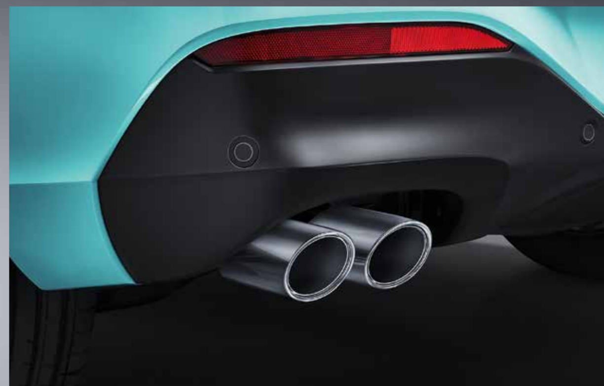
Športové koncovky výfukov