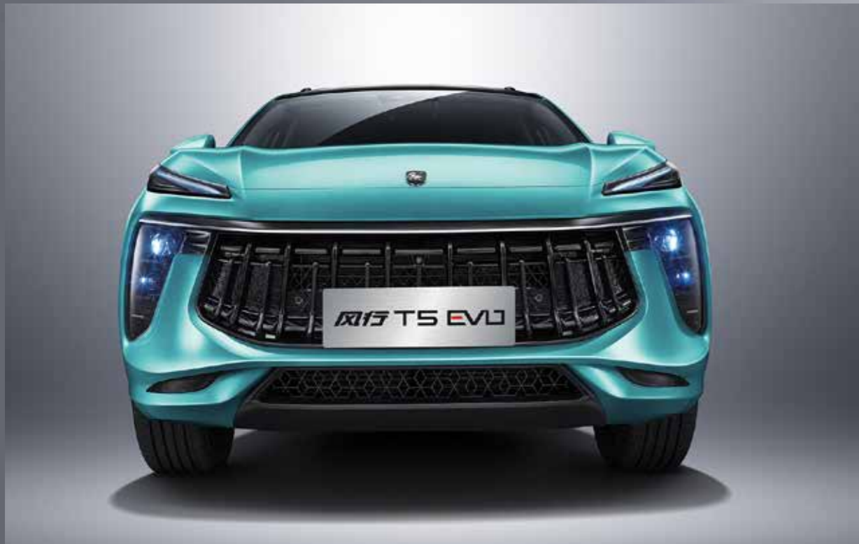
Športová predná maska