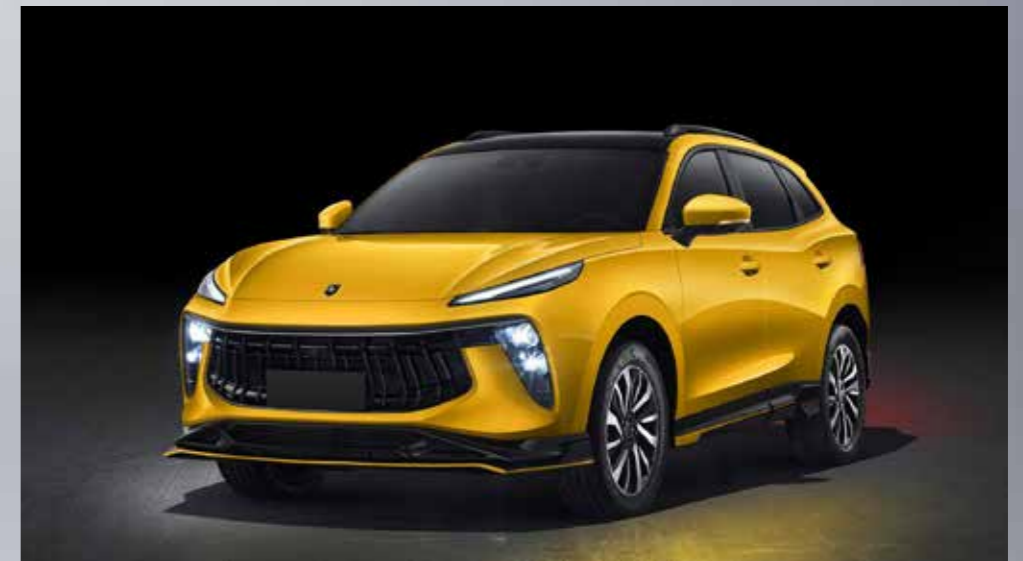
žltá (čierna strecha)*