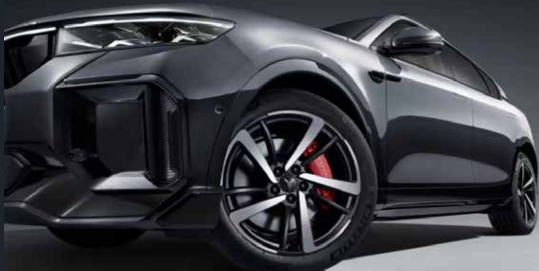
Dynamic Wheel Hub