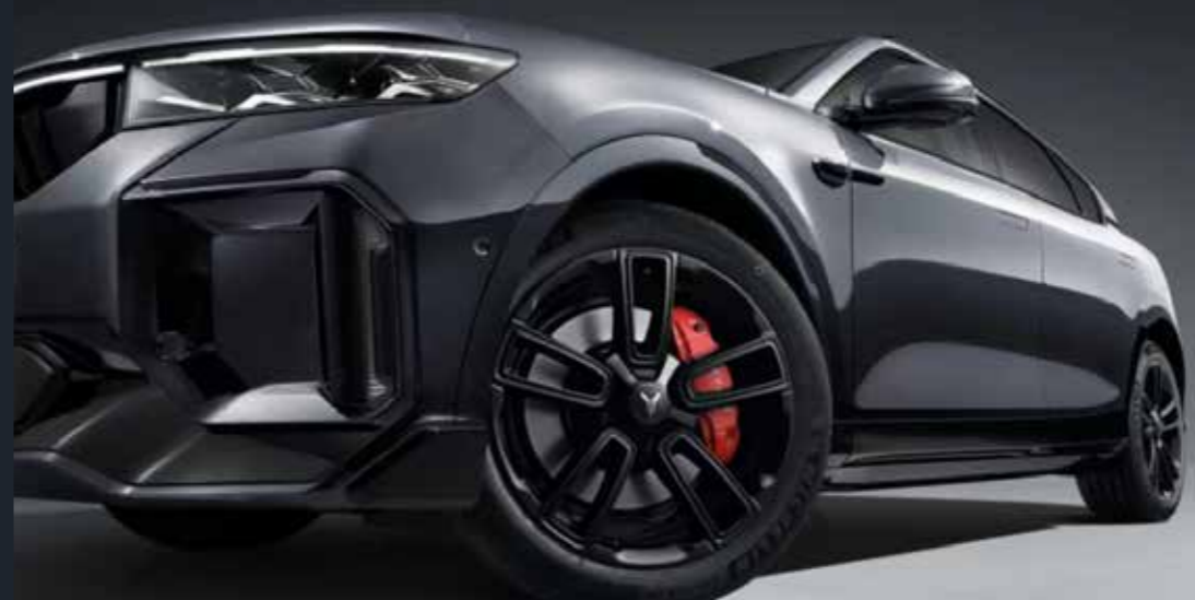
Star Ring Wheel Hub